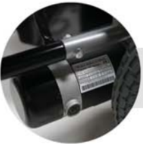
Motor com tração por redução e freio eletromagnético acoplado