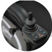
Comando New VR2 da PG Drives