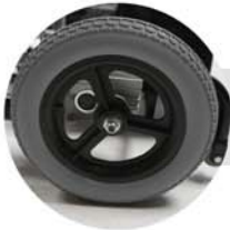
Roda em PVC com pneu antifuro